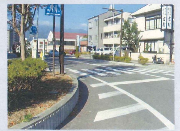
H23 改良後: 視距確保のため植栽を移植しました。