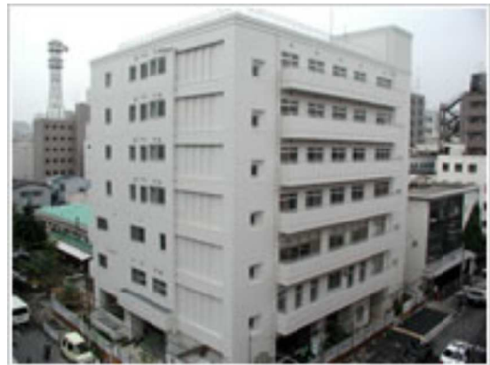
横浜市生活自立支援施設「はまかぜ」

原則として3か月利用でき、その間に自立に向けて住居や就労などの相談や支援を受けます。視察した日には、女性2名、男性126名が入所しているということでした。