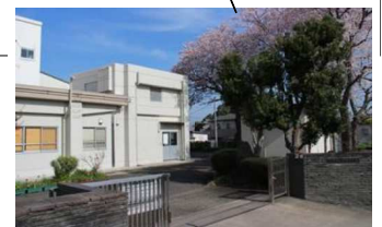
↑ 菅田小学校