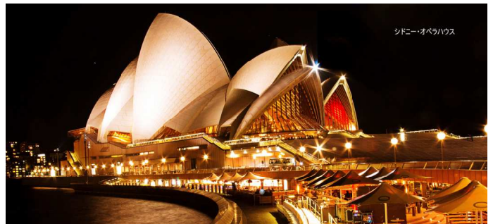
シドニーのオペラハウス

視察したあらかし由美子党市議団長は、「市長のいうオペラ・バレエ上演の劇場を整備してうまく行く保障はあるのか。なぜこんなに急いで決めるのか。今はコロナ対策など市が全力で取り組むべき時」とコメントしました。