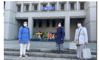
大阪市委員会本庁舎前