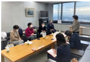
堺市教育委員会との懇談