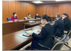
大阪市教育委員会との懇談