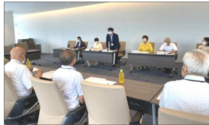
7/14 横浜市精神障害者地域生活支援連合会