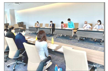
7/13 神奈川県保険医協会横浜支部