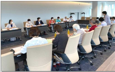
7/13横浜市精神障害者家族連合会