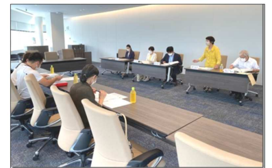
7/14 よこはま無認可・認可保育所手つなぎ協議会