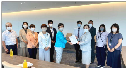
7/19 横浜市私立保育園こども園園長会