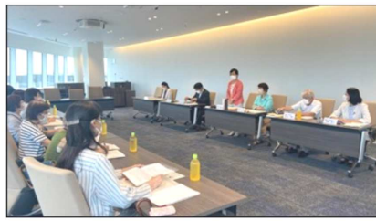
7/13 新婦人横浜18支部連絡会