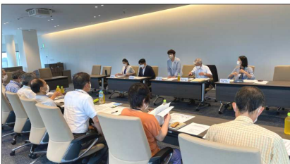
7/15 神奈川・横浜の夜間中学を考える会