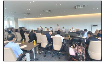
7/12 横浜市身体障害者団体連合会