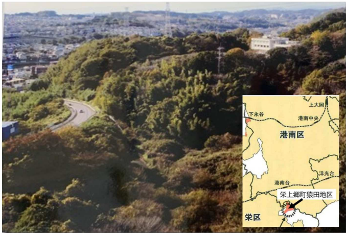
上郷深田遺跡を含む上郷猿田地区