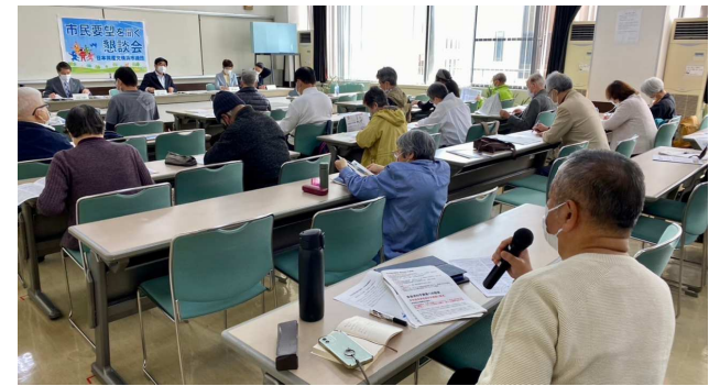
保土ヶ谷区懇談会の様子